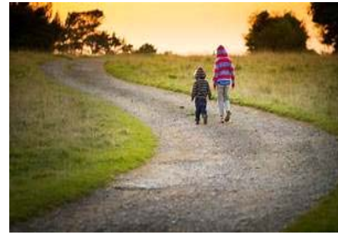
SEGNO DELLA CROCE. CANTO INIZIALE

Siamo riusciti durante il viaggio a parlare con tutti? Siamo sempre rimasti con i nostri soliti amici oppure abbiamo cercato di variare e parlare anche con altre persone? Riusciamo nella vita di tutti i giorni ad (come dice Gesù) "amarci gli uni gli altri"? Cerchiamo ogni giorno di instaurare amicizie con persone diverse?