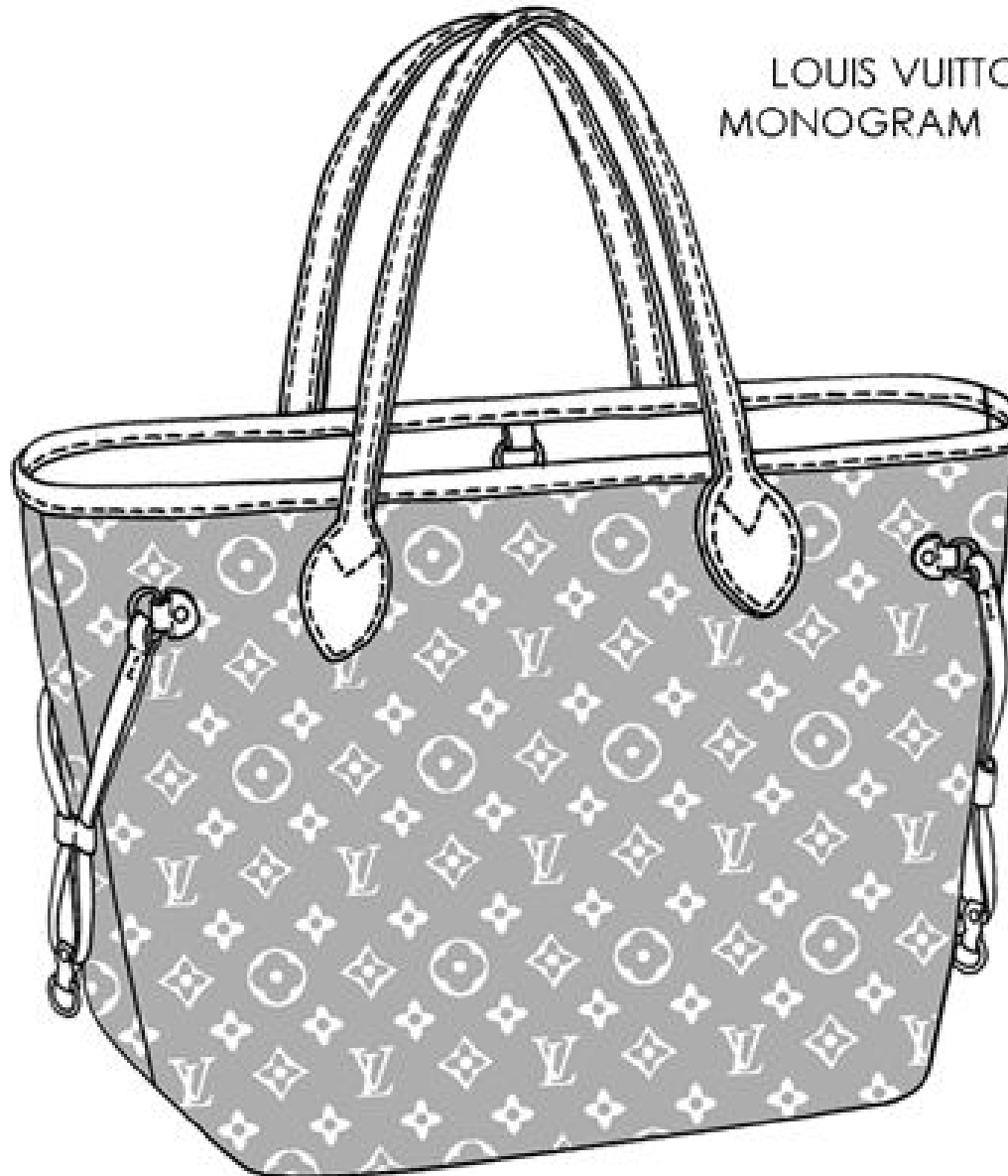
Illustration by Emily O'Rourke